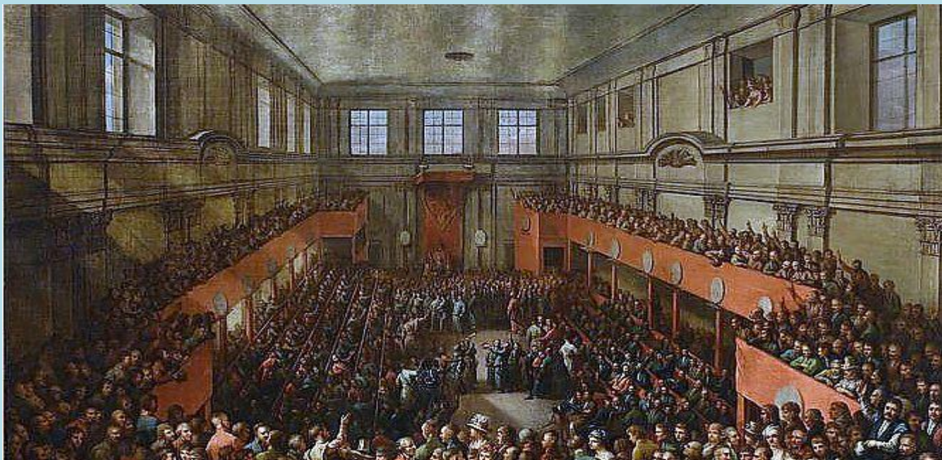
Kazimierz Wojniakowski, Uchwalenie Konstytucji, 1806, Muzeum Narodowe w Warszawie