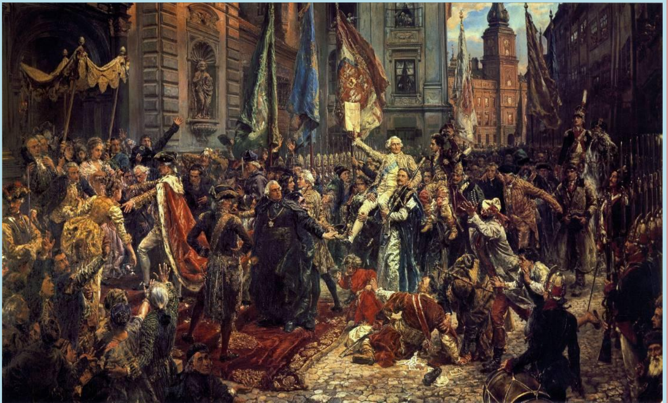
Jan Matejko, Konstytucja 3 Maja, obraz z 1891 r.