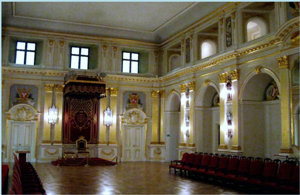
Sala Senatorska Zamku Królewskiego w Warszawie (miejsce uchwalenia Konstytucji 3 maja)