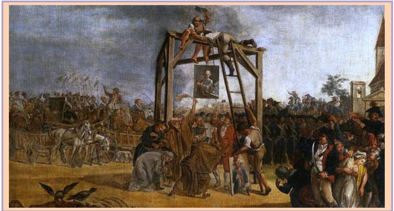
Fragment obrazu "Wieszanie zdrajców (in effigie)" aut. Jean Pierre Norblin de la Gourdainie

6. Epilogiem wojny polsko-rosyjskiej w 1792 roku i rządów Targowicy był II rozbiór Polski, dokonany w styczniu 1793 roku przez Rosję i Prusy.